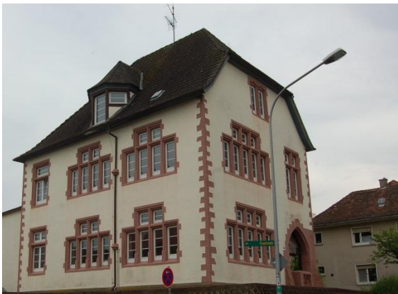
Die „Alte Schule“ steht leer und ist im städtischen Eigentum .