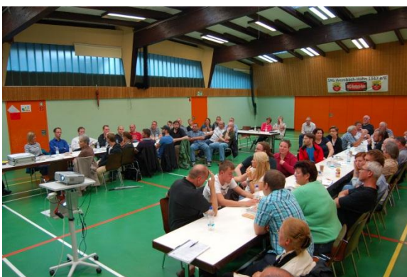
Der anschließende Workshop fand in der Waldenserhalle statt