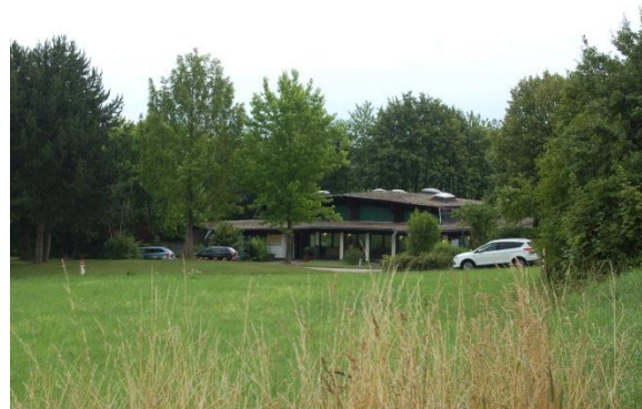
Blick auf die Waldenserhalle.