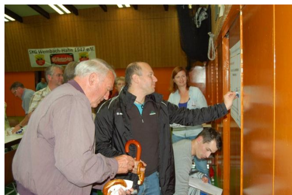
Die Teilnehmerinnen und Teilnehmer bewerten die Zukunftsfähigkeit ihres Stadtteils