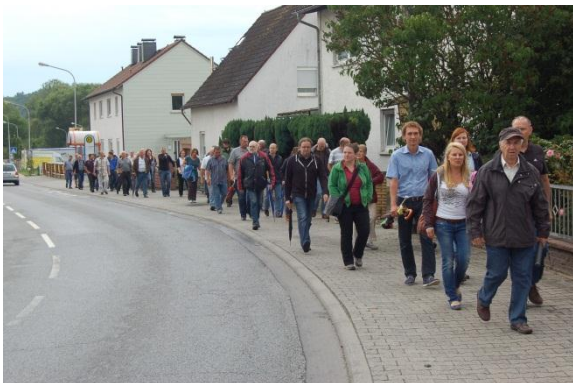
Rund 50 Teilnehmerinnen + Teilnehmer nahmen Stadtteilrundgang durch Wembach-Hahn teil.