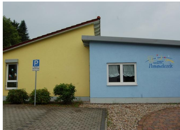
Die evangelische Kindertagesstätte „Himmelszeit“