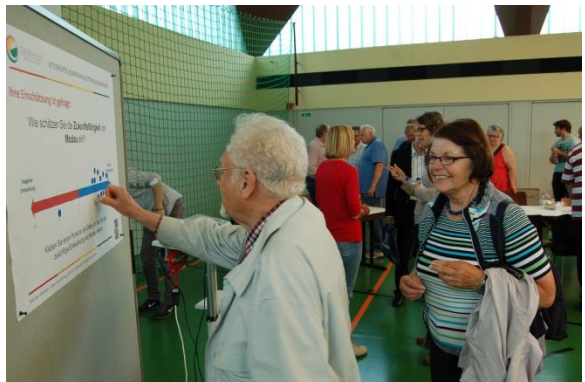
Die Teilnehmerinnen und Teilnehmer bewerten die Zukunftsfähigkeit ihres Stadtteils