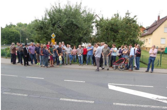
Rund 45 Teilnehmerinnen + Teilnehmer diskutieren die Situation in Nieder-Modau