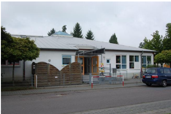
Der evangelischen Kindergarten in Nieder-Modau