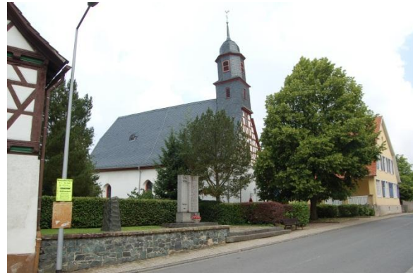
Blick auf die ev. Kirche im historischen Ortskern