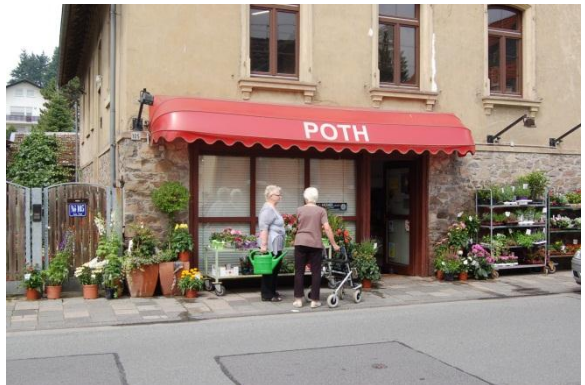
Ein kleiner Blumenladen an der Ortsdurchfahrt Odenwaldstraße L3099