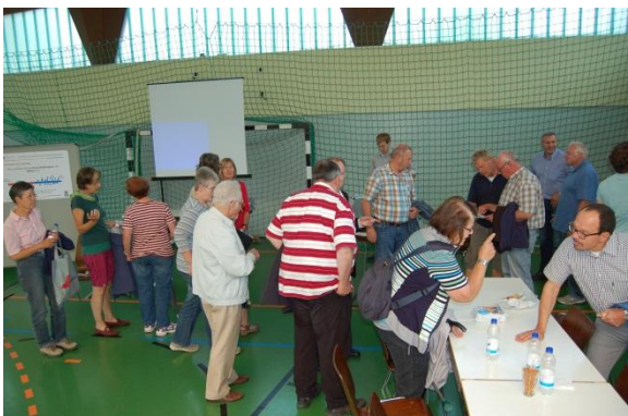
Der anschließende Workshop fand unter aktiver Beteiligung in der Modauhalle statt