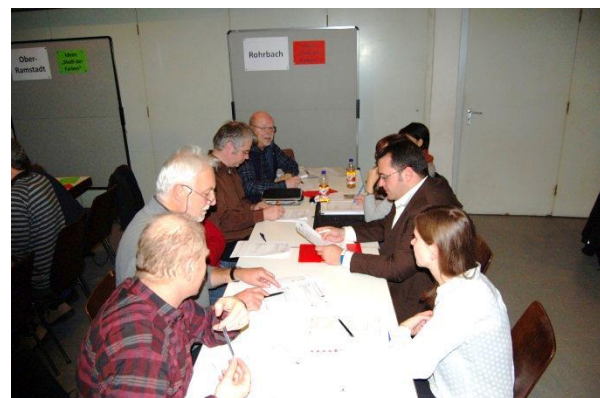
Die IKEK-Team Mitglieder diskutieren/prüfen die Ziele des Stadtleitbildes für Ober-Ramstadt