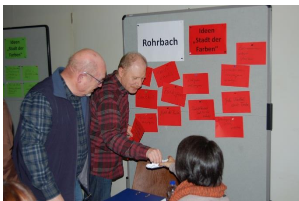
Sammlung der Ideen auf Karten für die Pinnwand.

Die IKEK-Mitglieder formulierten in rund 20 Minuten ihre Ideen auf Kärtchen und hefteten diese an die Pinnwände. Zum Anschluss präsentierten die einzelnen Gruppen ihre Ideen/Vorstellungen zur Umsetzung des Slogans.